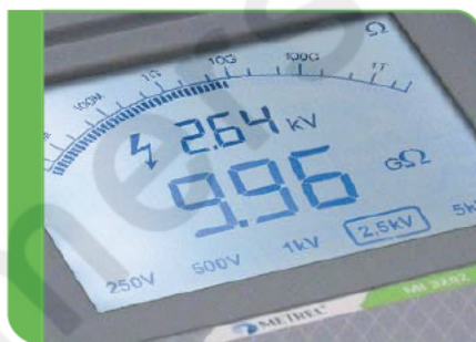
Duży ekran LCD