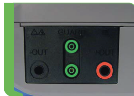
Zacisk GUARD eliminujący wpływ rezystancji powierzchniowej